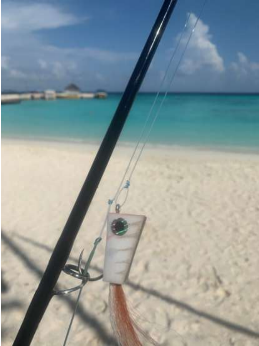
Not Your Average Popper (NYAP) für GTs