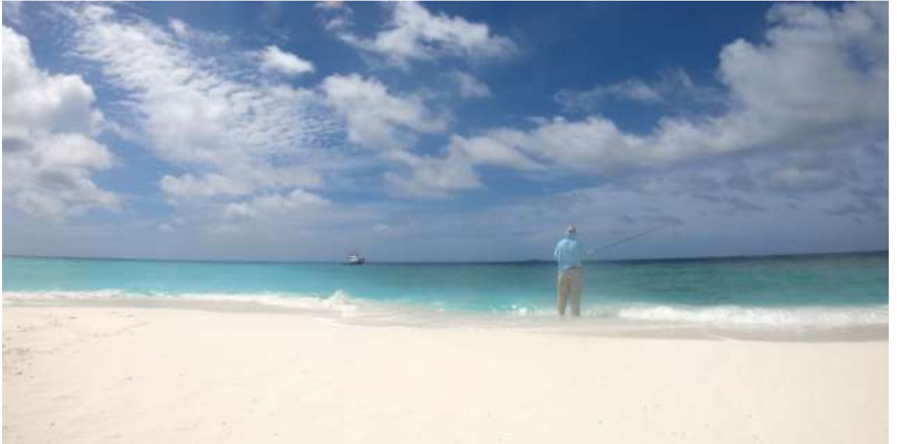
Die Ocean Fun am Horizont, die Zwölfer Rute im Anschlag