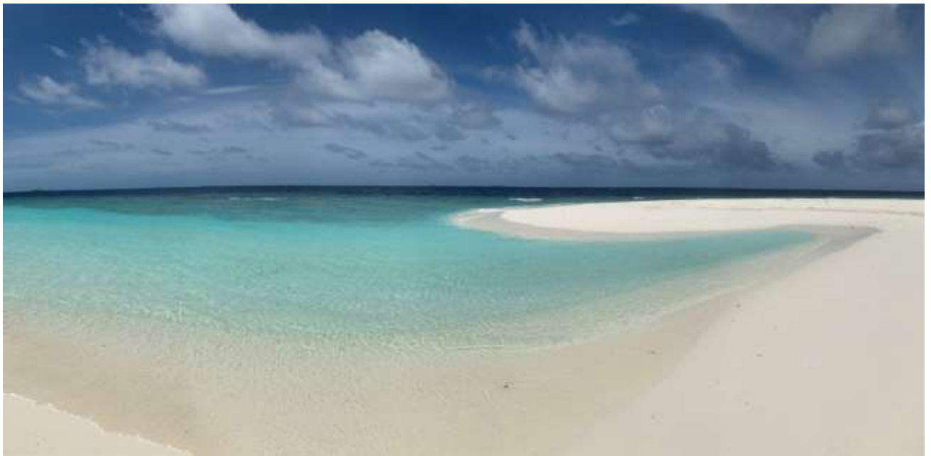
Panorama-View von der Sandbank