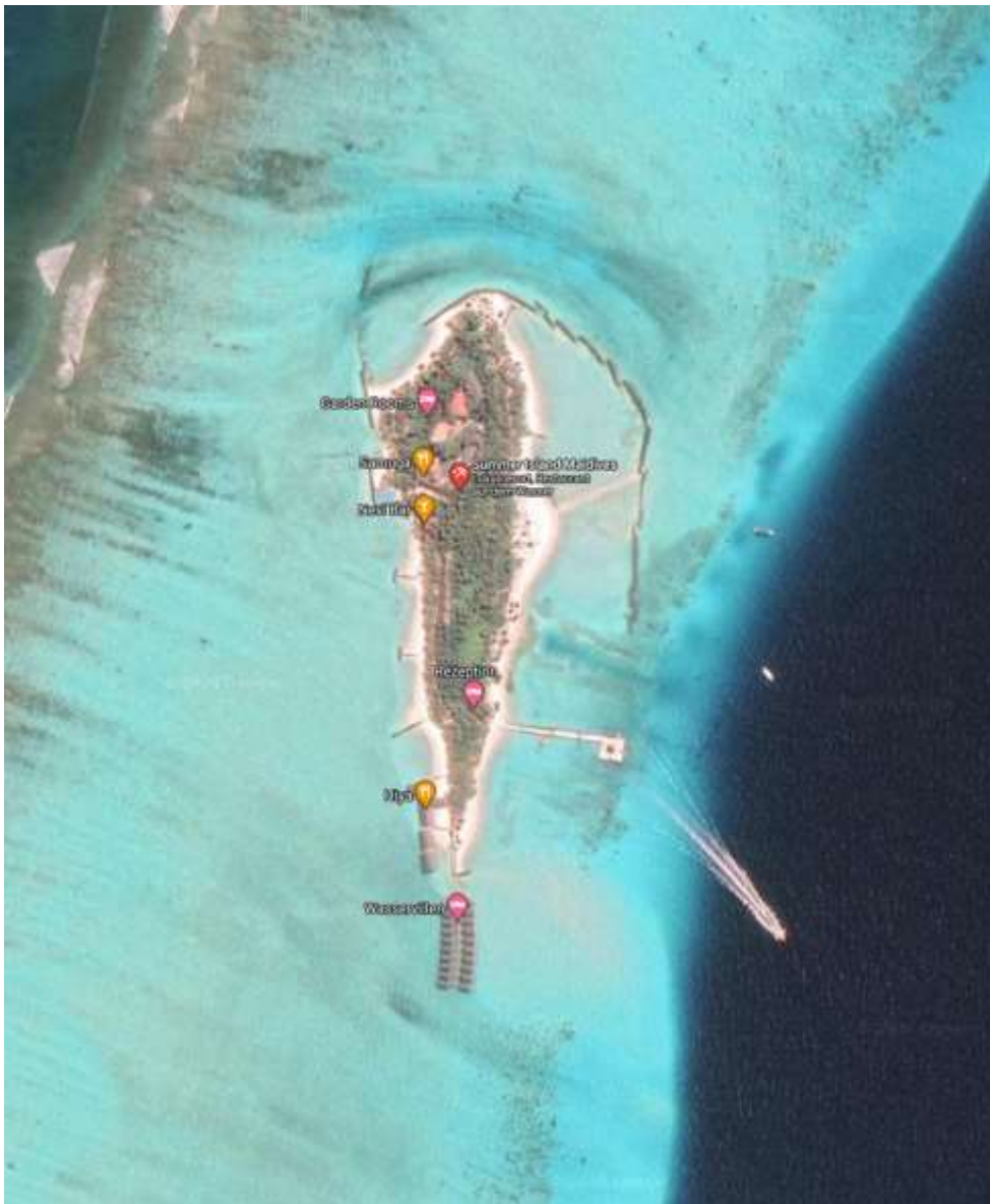
Das Resort auf Google Maps

Wir wählten die Weiterfahrt mit einem Speedboat, da der Flug mit einem Wasserflugzeug zu kurz und aus unserer Sicht zu teuer gewesen wäre. An Board des Boots wurden wir sofort vom freundlichen und herzlichen Hotelpersonal in Empfang genommen und mit gekühltem Wasser aus wiederverschließbaren Glasflaschen und kalten Waschlappen für das Gesicht in Empfang genommen. Die anschließende Fahrt dauerte noch einmal circa 40 Minuten. Im Resort angekommen, checkten wir erst einmal ein und erkundeten die kleine aber atemberaubende Insel. Insgesamt ist diese Insel circa 100 Meter lang und im Durchschnitt 30 Meter breit. Der/die eine oder andere stellt sich nun die Frage: „Und da soll man es zehn Tage aushalten?“ Dem kann ich nur mit einem euphorischen: „Oh JA!“ entgegenen. Es wird vom Personal alles getan, dass man sich als Gast sehr wohl fühlt. Es gibt unzählige Aktivitäten, die teilweise kostenlos sind, oder die man hinzubuchen kann, das Essen war phänomenal gut und die Natur lässt einen einfach nur staunen. Wer mehr über dieses Resort erfahren möchte, dem empfehle ich, sich die Internetseite des Hotels anzuschauen.