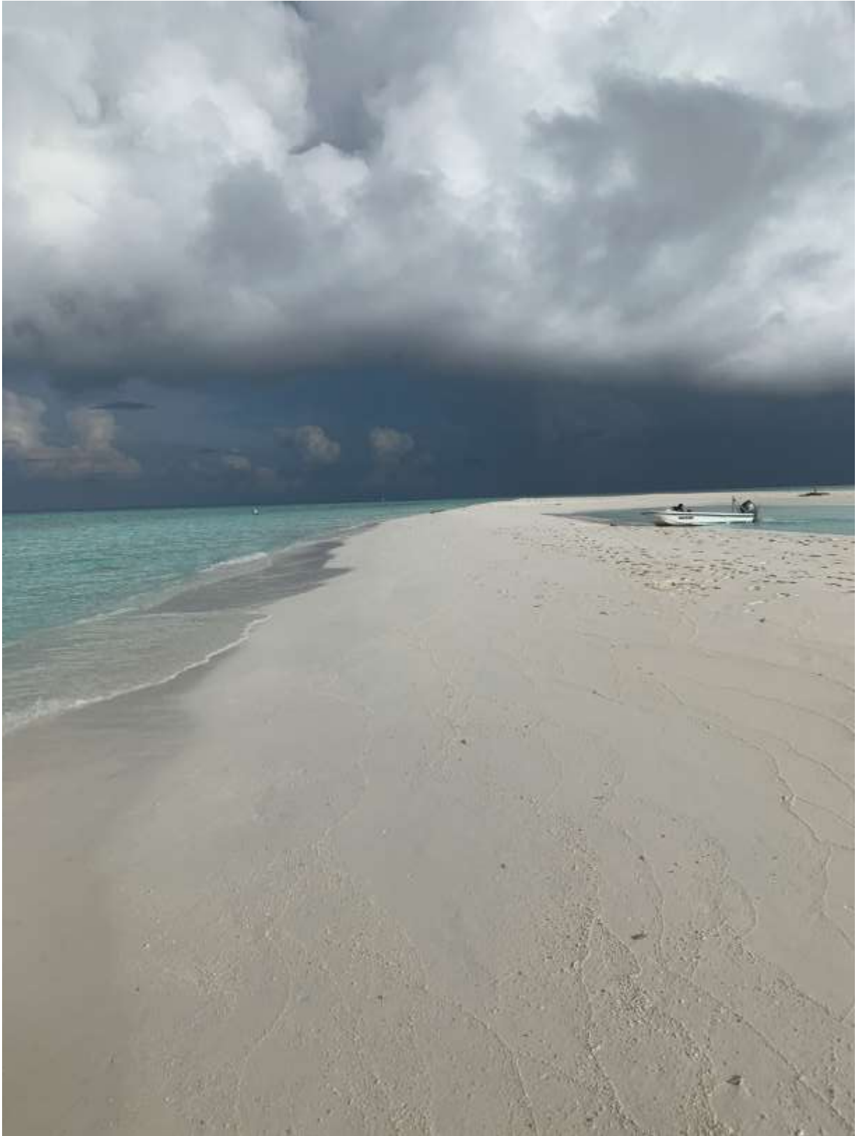
Ein Gewitter zieht auf