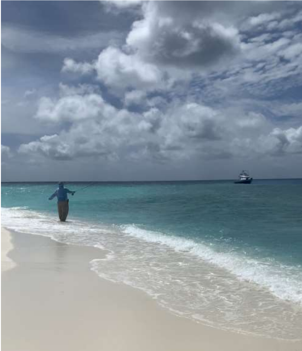
Feeling wie auf dem Mond

Ich fischte was das Zeug hielt und die Zeit verging wie im Flug. Diese ganze Situation hatte etwas Surreales. Ich fühlte mich ein wenig wie auf dem Mond. Wir, ganz alleine auf dieser Sandbank, am Horizont nur Wasser und die knallende Sonne. Ich konnte das Salz, das durch die erfrischende Brise auf meine Lippen traf, schmecken und fokussierte mich nur auf die Casts. Es war das erste Mal, dass ich die Zwölfer Rute benutzte und das sollte sich schnell rächen. Ich musste rasch feststellen, dass ich zu viel Zeit in das Binden von Fliegen investierte und zu wenig Zeit in die Übung von Casts mit so einer schweren Rute. Für diejenigen, die noch nie eine Zwölfer Rute in der Hand hielten: stellt euch vor, ihr schwingt den ganzen Tag einen Baseballschläger. So fühlt es sich an.