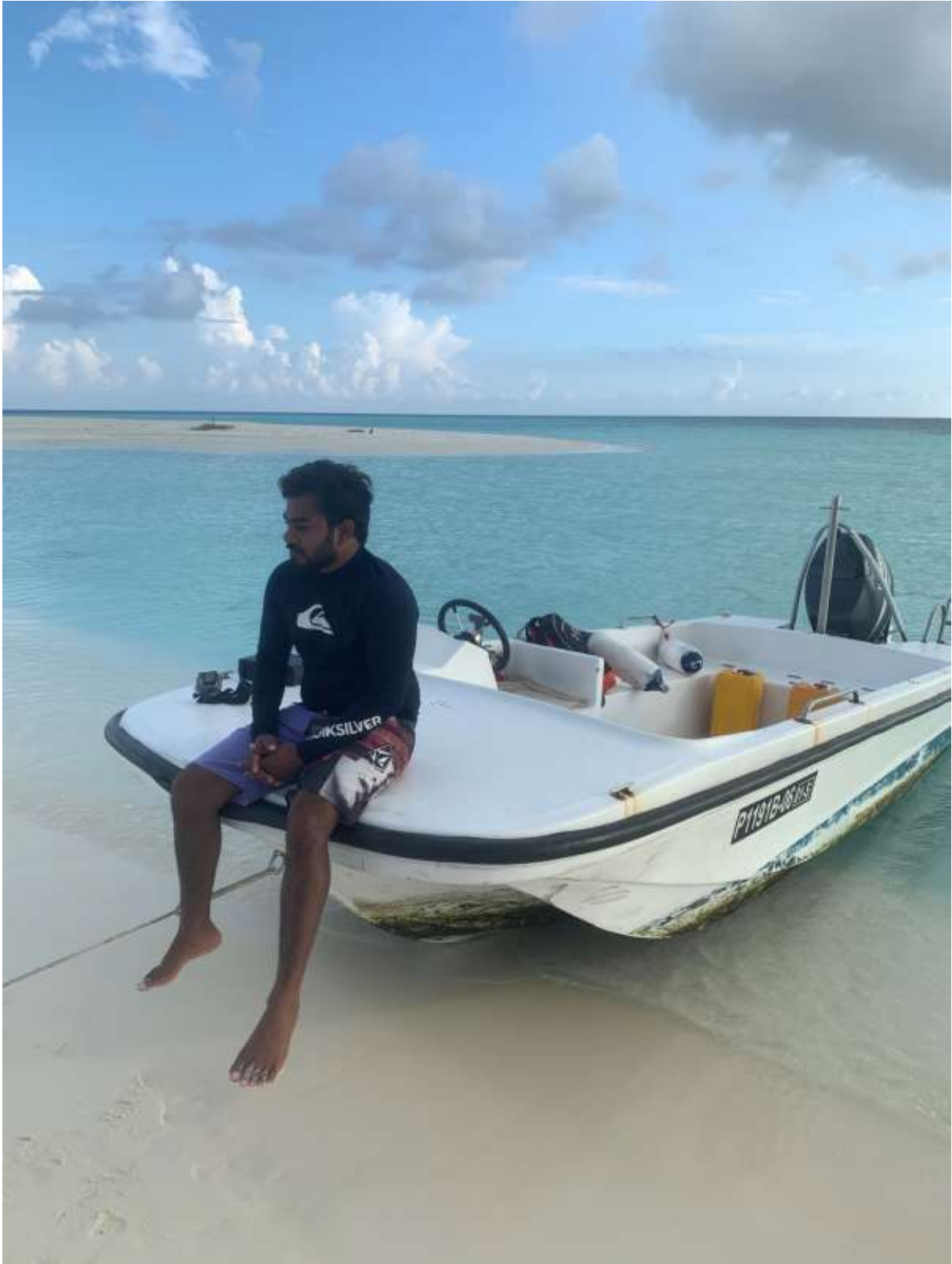
Ximi mit geankertem Boot