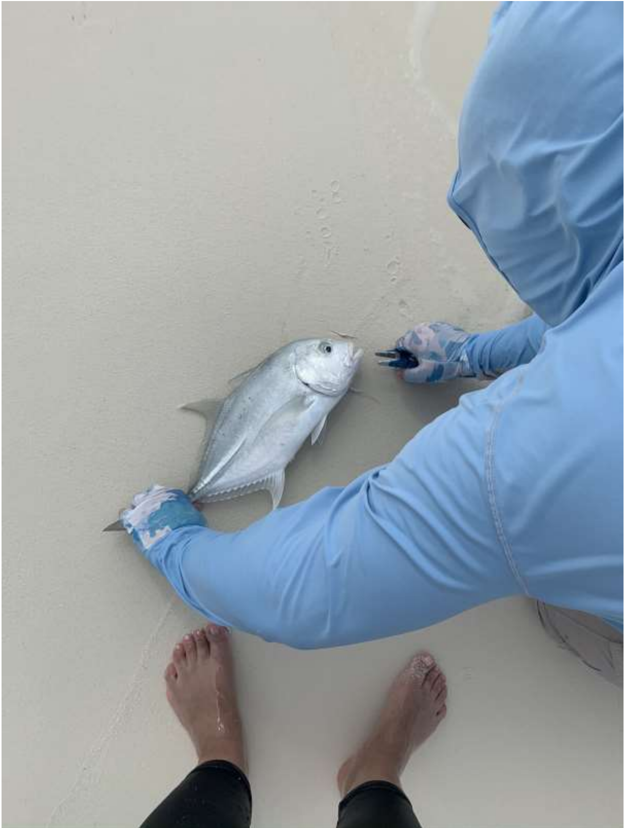
Mein erster GT!