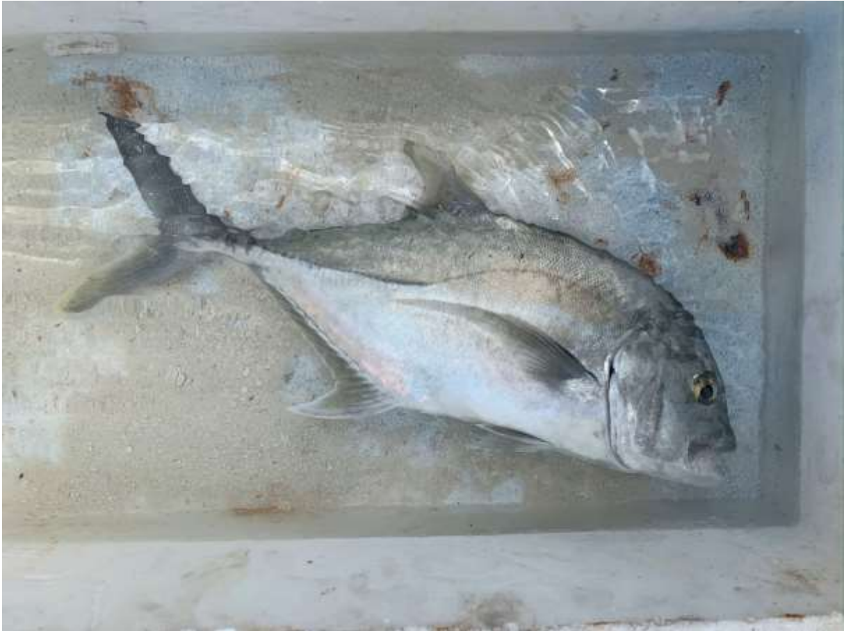
GT in der Transportbox, die mit Wasser gefüllt ist

Die Crew der Ocean Fun bemerkte dies und einer von ihnen schwamm zur Sandbank, um den Trevally mit an Board zu nehmen und ihn für uns als Mittagessen zuzubereiten. Ich fischte noch weiter, konnte aber keine nennenswerten Fänge mehr verzeichnen. Das war mir jedoch egal, hatte ich doch meinen Trevally schon gefangen. Nach drei Stunden auf der Sandbank war die Zeit um und wir mussten zurück an Board. Da gab es nur ein Problem. Die Haie. Für den Rückweg zum Boot instruierte man uns mit den Worten: „Keep calm, don't make fast moves, keep your hands on the body and let the current do the work.“ Für mich jedenfalls hörte sich das nicht wirklich vertrauenserweckend an. Aber es führte ja nur ein Weg zum Boot. Der Transfer verlief glücklicherweise ohne große Zwischenfälle. Nun ja, einen gab es. Das Dry Pack, in dem ich Ersatzschnüre und Kamera-Equipment wie Akkus etc. hatte, war leider nicht dicht. Als ich die Leiter hinauf zum Boot kletterte merkte ich schon, dass die Tasche extrem schwer war. Oben angekommen konnte ich mehrere Liter Salzwasser aus der Tasche auskippen. Die Akkus waren sofort tot und die Schnüre, die noch originalverpackt waren, klitschnass. Damit hatte ich für den Rest des Trips nur noch einen Akku zur Verfügung. „It is, what it is“ sagte ich mir – wahrscheinlich von den ganzen Erfahrungen überwältigt – und trocknete mich ab.