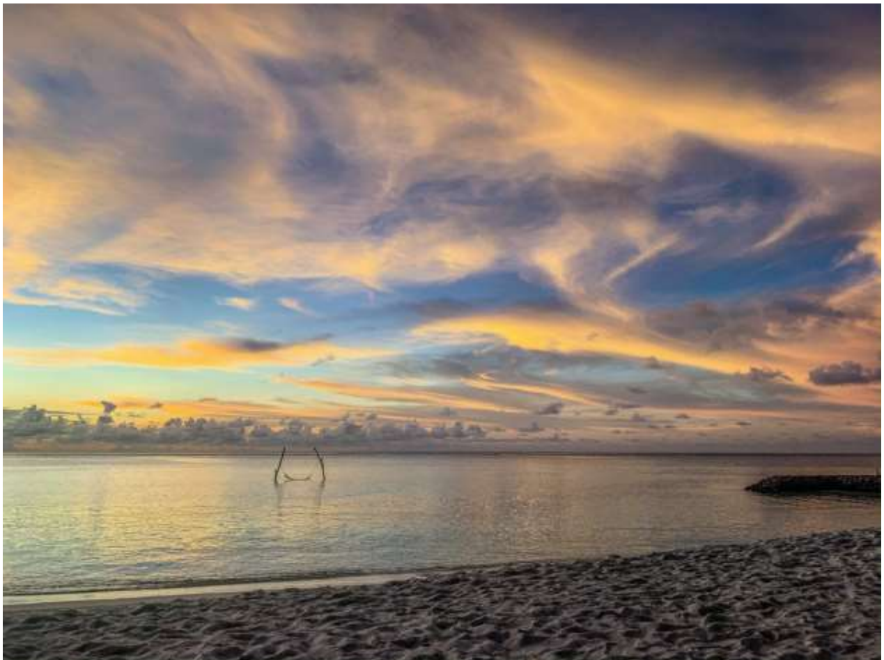
Sonnenaufgang auf den Malediven