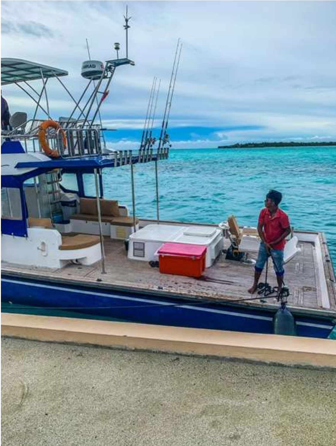
Die Crew packt kräftig mit an