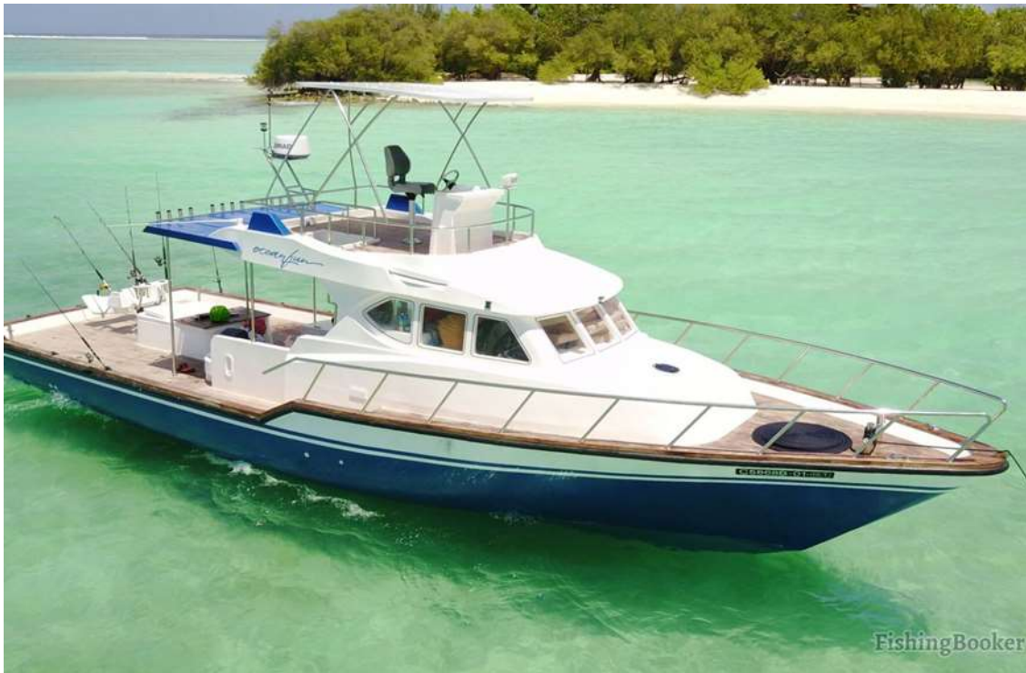
Die Ocean Fun, wie sie auf Fishingbooker.com beworben wird