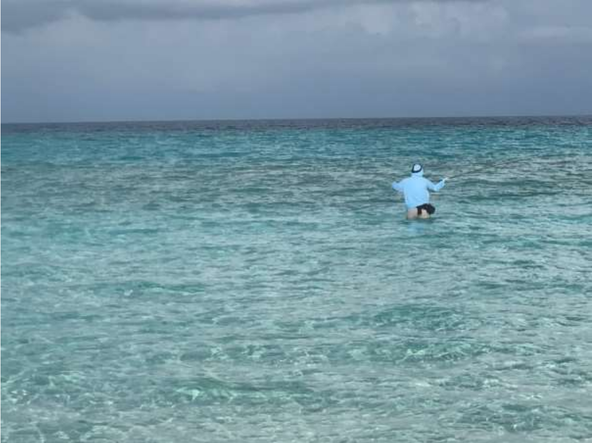
Never stop fishing!