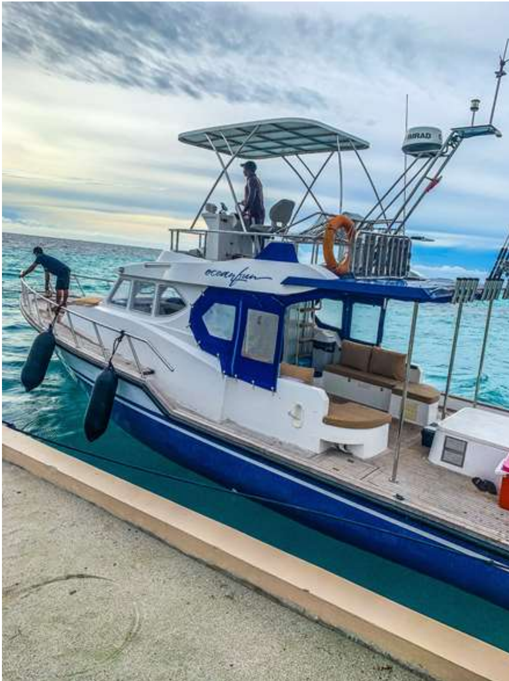
Hammeed steuert die Ocean Fun, um am Resort anzulegen

diesem Tag suboptimal, sodass wir sehr starken Wellengang und starken Wind hatten. Naja mal sehen, dachte ich mir.