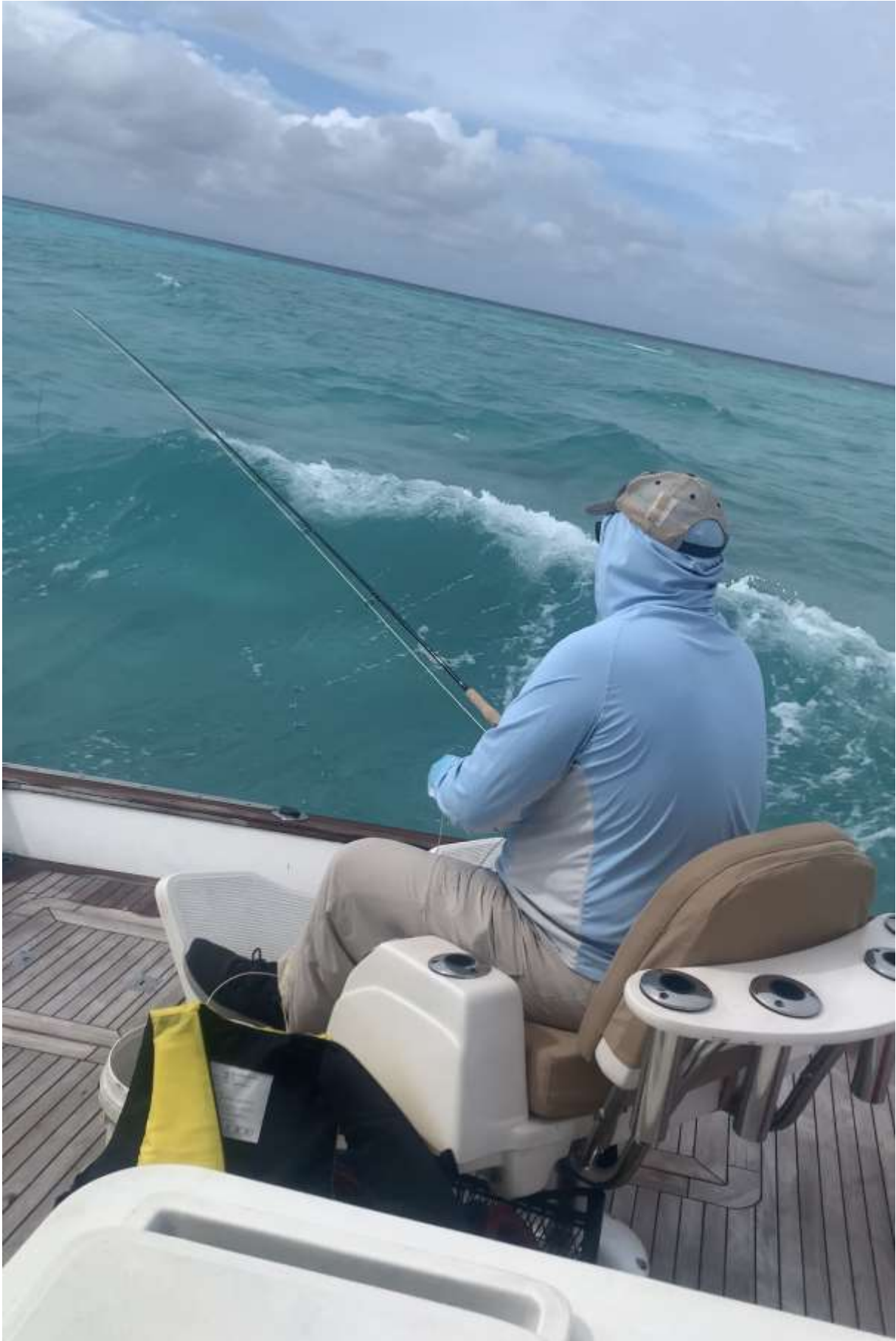
Zu starker Wellengang: Ich probiere im Battle Chair an Board zu bleiben