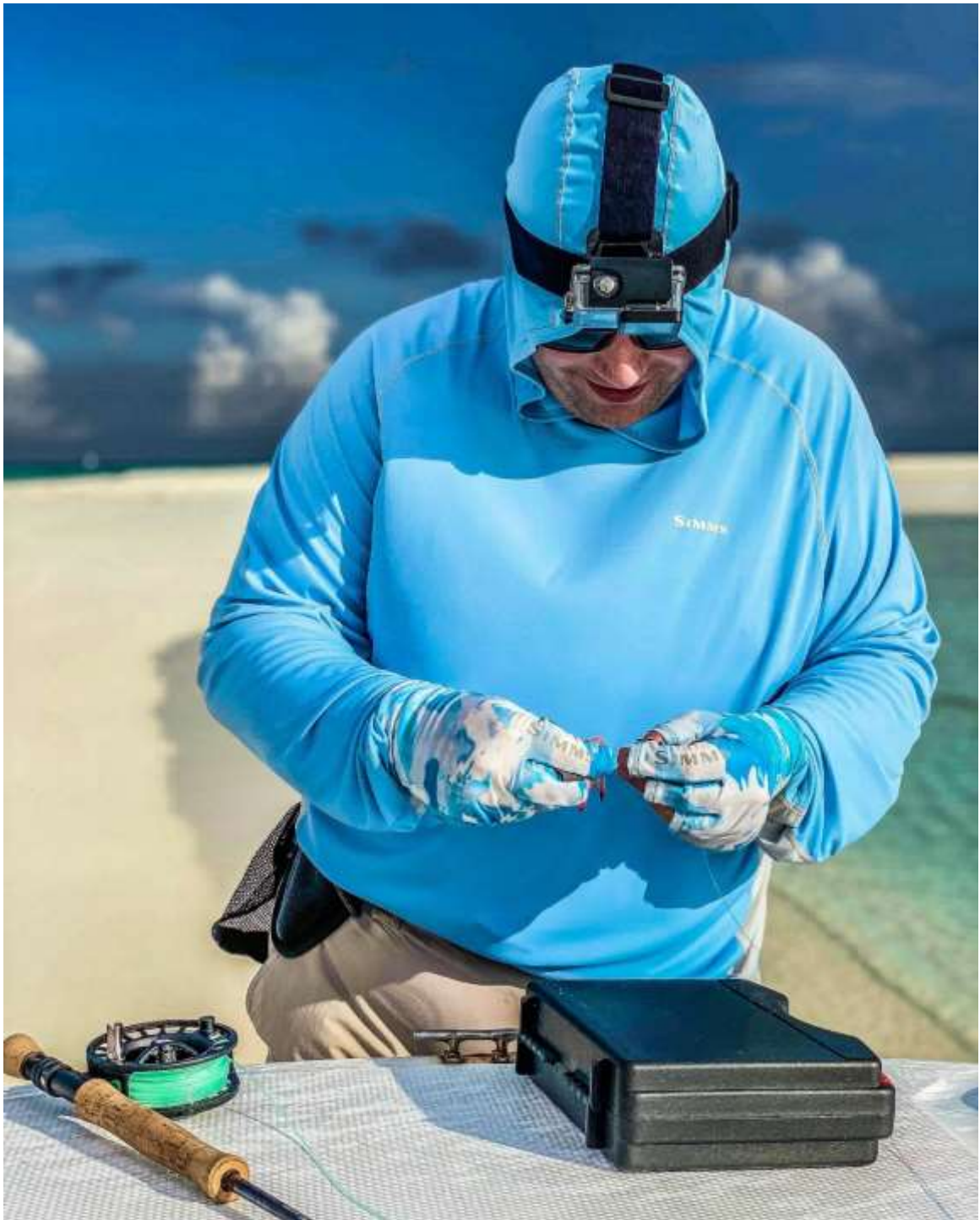
Ein schwimmendes Krabbenmuster muss her