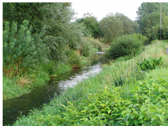
Helme bei Sundhausen